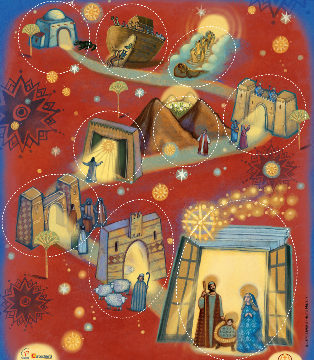
Illustrazione di Ailda Massari